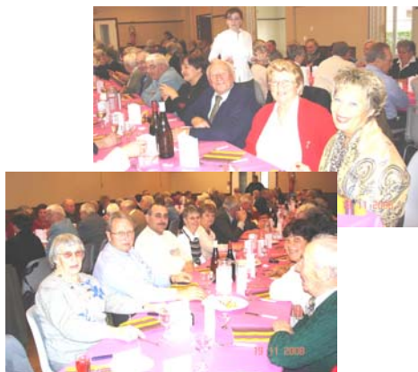
La chorale du Conseil ( de gauche à droite.....)